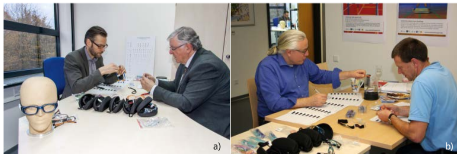
Abb. 2a-b: Expertenrating

Vor diesem Hintergrund hat die RUB einen Schulsportbrillentest entwickelt, bei dem die getesteten Brillen in zwei Kategorien eingeteilt werden: „Schulsporttaugliche Brillen“ müssen die Anforderungen an den Einsatz im Schulsport – die 2013 von der Arbeitsgemeinschaft Sicherheit im Sport (ASiS) im Konsens zwischen Experten der Augenärzte- und Augenoptikerverbände (BVA, ZVA, WVAO, VDCO) sowie der RUB-Sportmedizin definiert wurden – er-