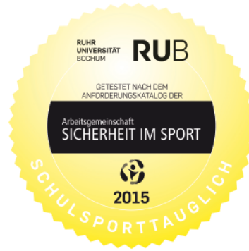
Abb. 3a–b: Prüfplaketten

Der „RUB-Schulsportbrillentest“ ist in drei Bereiche unterteilt: Objektive, normbezogene Tests im zertifizierten Prüflabor (s. Abb. 1a–d), Sportwissenschaftliche (Labor-)Tests, bei denen u. a. standardisierte „Beschuss-Versuche“ der Brillen mit unterschiedlichen